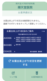
※お薬準備状況 表示例

1号館1階のお薬引換え窓口に表示されているような、お薬出来上がり状況が確認できます。